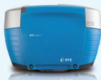
Color multiángulo y efecto BYK-mac i